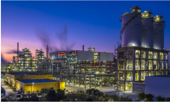
嘉兴石化二期 PTA 装置夜景